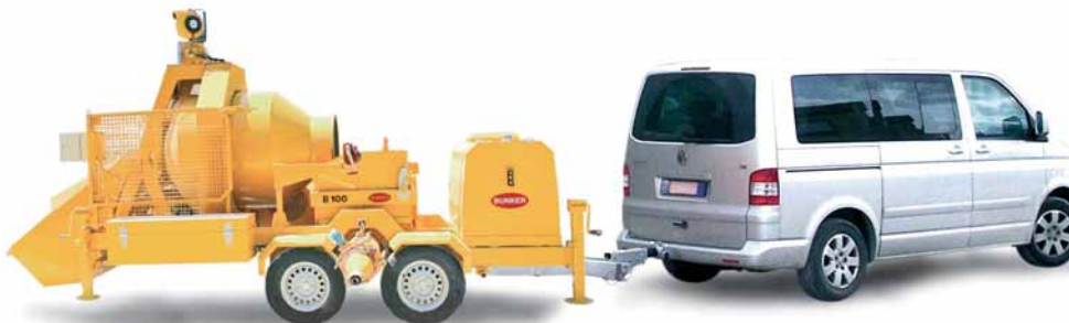
B100xp equipaggiata con assale ALKO in tandem con freno a repulsione

Impianto trainabile per la preparazione ed il pompaggio del calcestruzzo