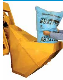
Carico polistirene espanso in perle additate