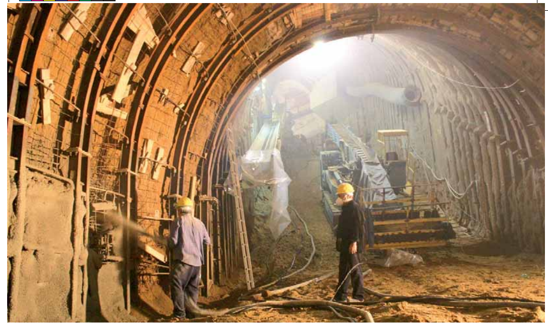
Spritz Beton in galleria metropolitana di Napoli