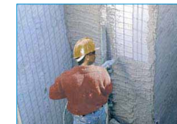
Spruzzatura di betoncino su pannelli di polistirene con rete metallica