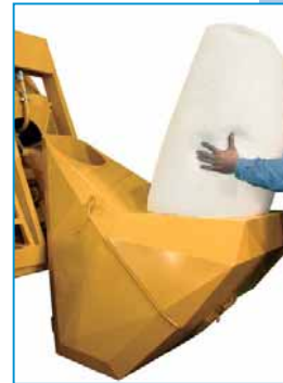
Carico polistirene espanso in perle

La B100 XP ne permette la produzione e la posa in opera in modo automatico, implicando un modestissimo fabbisogno di mano d'opera, e rendendo il cemento cellulare il materiale isolante termico e acustico più pratico, efficace ed economico.