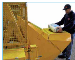
Dispositivo montato sulla benna per la rottura del sacco

Per la realizzazione del calcestruzzo proiettato è possibile corredare la B100xp di un serbatoio o di una pompa per accelerante di presa.