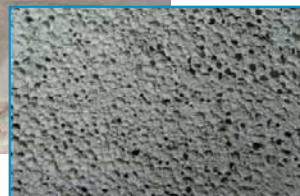
struttura del cemento cellulare