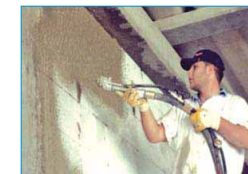
Spruzzatura di intonaco