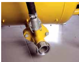
Saída ligação tipo parafuso