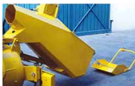
Caçamba de carga com pá raspadora

sujeitos a alterações - © 2009 by TEK,SP,ED - todos os direitos reservados - impresso em Itália - 200202 0909 PT