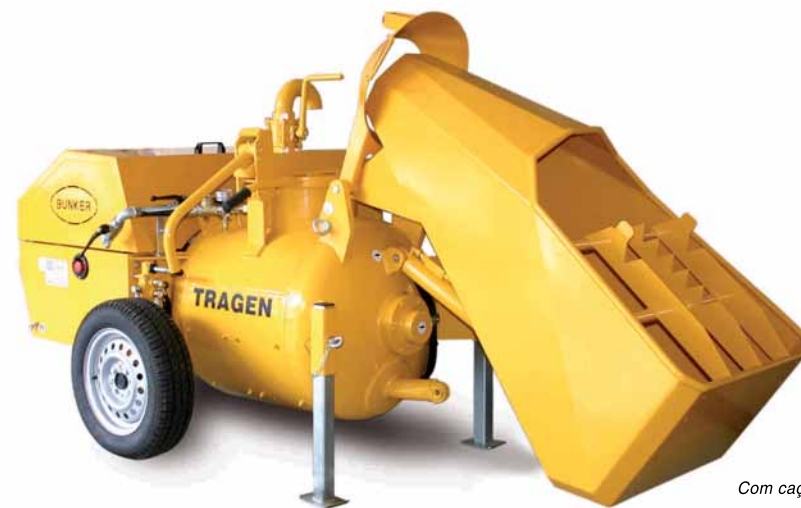
Com caçamba de carga