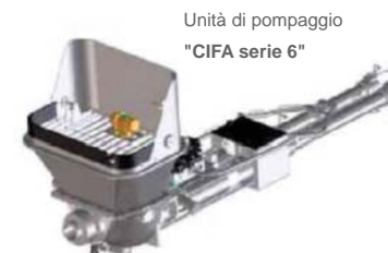
Unità di pompaggio " CIFA serie 6 "

La B100 xp a pistoni, è equipaggiata dell'unità di pompaggio " CIFA serie 6 " a cilindrata variabile e potenza costante.