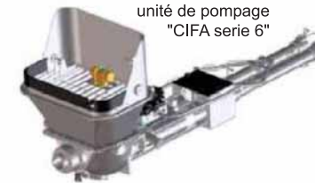
unité de pompage "CIFA série 6"

La B100XP est équipée d'une unité de pompage "CIFA série 6" d'une puissance constante grâce à sa cylindrée variable.