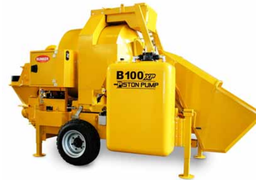
Vibrateur électrique sur la trémie béton