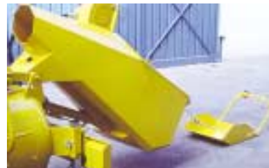
Cuchara de carga con pala rascadora