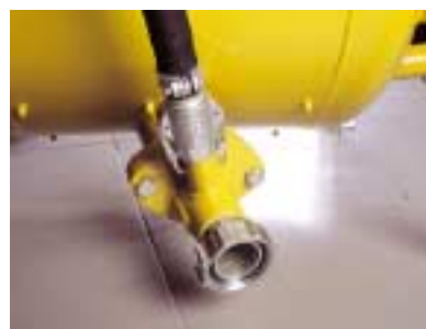
Salida conexión de tornillo